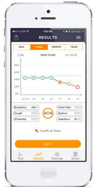
Graphische Darstellung des Trends von Spitzenfluss oder FEV1